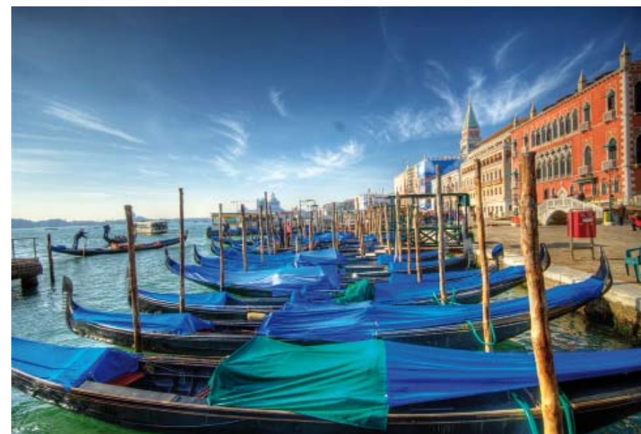
La capital de la región de Véneto se convierte en carnaval en puro espectáculo.